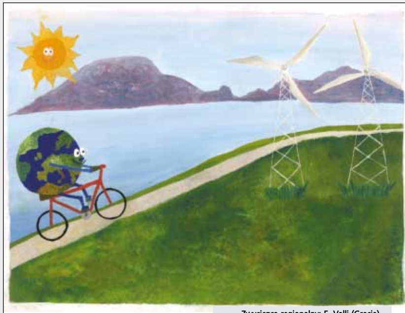
Zwycięzca regionalny: E. Valli (Grecja)

od kolektorów słonecznych począwszy na energii geotermalnej skończywszy.