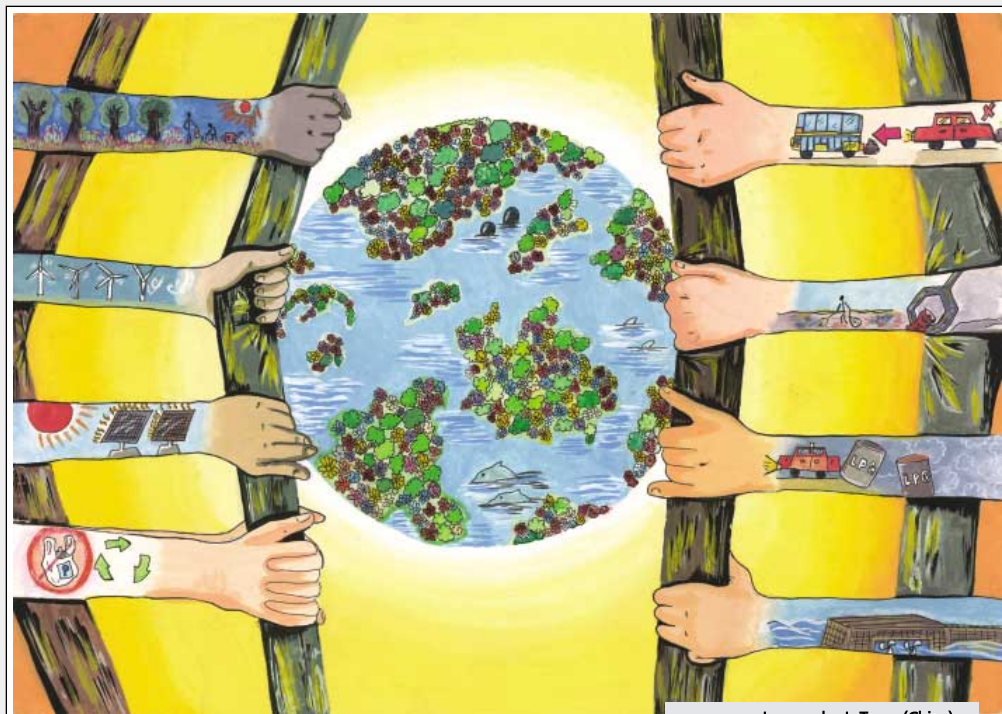
I nagroda: I. Tung (Chiny)

Zmiany klimatyczne i degradacja środowiska to problemy, z którymi od długiego czasu starają się uporać całe rzesze specjalistów niemalże z całego świata. Prowadzone są szeroko zakrojone prace rządowe oraz inicjatywy prywatne, mające na celu ograni-